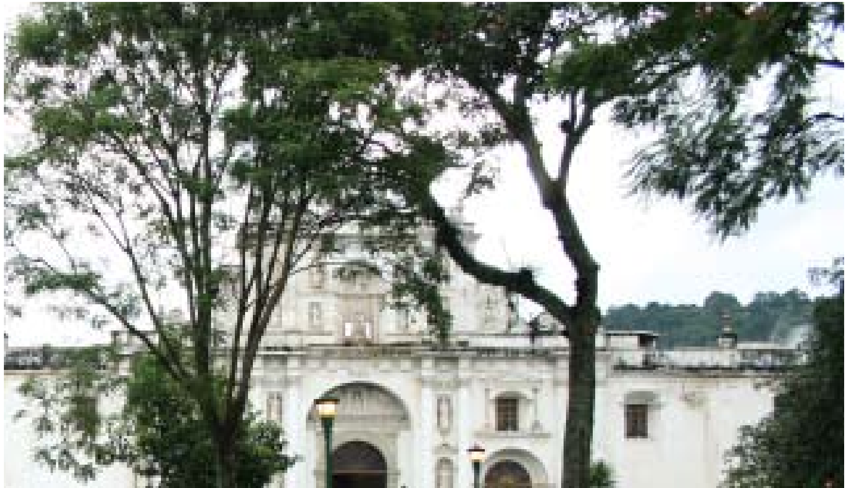
Plaza Mayor y Catedral de Antigua Guatemala. LMeléndez.

Vale la pena recordar brevemente este hecho. Era el 11 de septiembre de 1541, y el luto dominaba a la joven ciudad, pues doña Beatriz de la Cueva había enviudado, al fallecer el conquistador Pedro de Alvarado. Invasión por el dolor, mandó pintar de negro su palacio, y fue nombrada gobernadora de Guatemala, el 9 de septiembre de ese mismo año. Se le conoció entonces como “La Sinventura Doña Beatriz”.