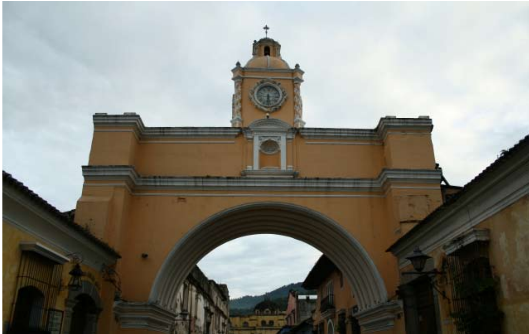
Vista de la 5 avenida norte, conocida actualmente como Calle del Arco. L.Meléndez.

se fundó en Santiago de Guatemala, se encuentra en la 2ª avenida norte y 2ª calle oriente. Es una obra monumental y muy bien conservada. La licencia de construcción data de 1725, y la obra corrió a cargo de Diego de Porres.