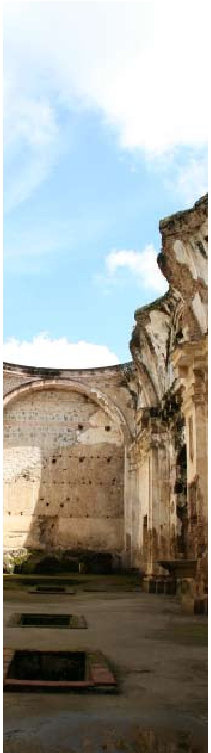
Arriba derecha. Vista de cuarto subterráneo y marco de piedra maciza de Antigua Guatemala. LMeléndez . Abajo derecha. Detalle de cerradura y textura de una puerta tradicional de Antigua Guatemala. LMeléndez . Izquierda. Vista del patio secundario de las ruinas de la Iglesia de Santa Clara, Antigua Guatemala. LMeléndez .