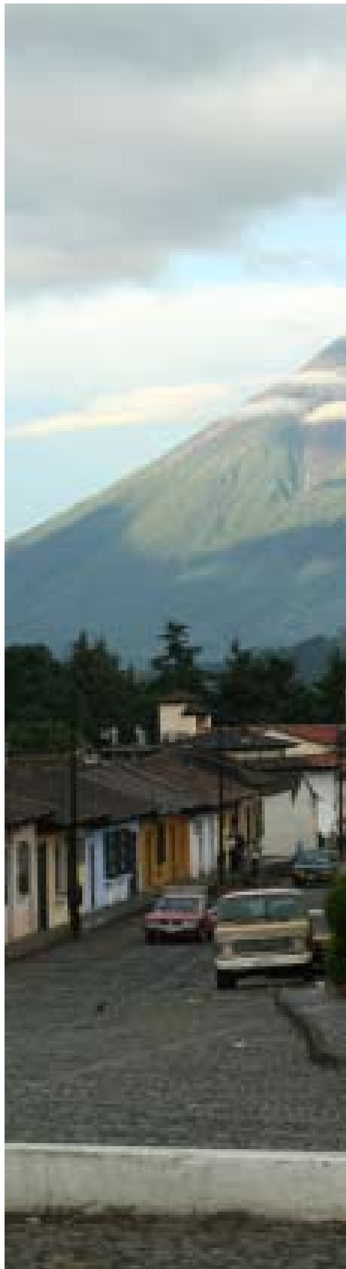
Vista de la entrada principal a la ciudad de Antigua Guatemala. Atrás, Volcán de Agua, Volcán Acatenango y Volcán de Fuego. L.Meléndez.

A la usanza española del siglo XVI, y en acatamiento a las Leyes de Indias, el trazo sigue el sistema de calles tiradas a cordel con orientación norte-sur y oriente-poniente. En el centro de la ciudad está la Plaza Mayor, con la antigua Fuente de Las Sirenas, obra construida en 1739 por Diego de Porres. Según cuentan las leyendas, estas sirenas representan a las cuatro hijas de un rey que fueron amarradas por su padre a un palo, cerca de un ojo de agua, por haberse negado a amamantar a sus hijos. Rodean al parque, siguiendo el tradicional trazo de parrilla tan utilizado en la urbanística española de la colonia, el Palacio de los Capitanes Generales, el Ayuntamiento, la iglesia de San José, anteriormente Catedral de Guatemala, el Palacio Arzobispal y el Portal del Comercio.