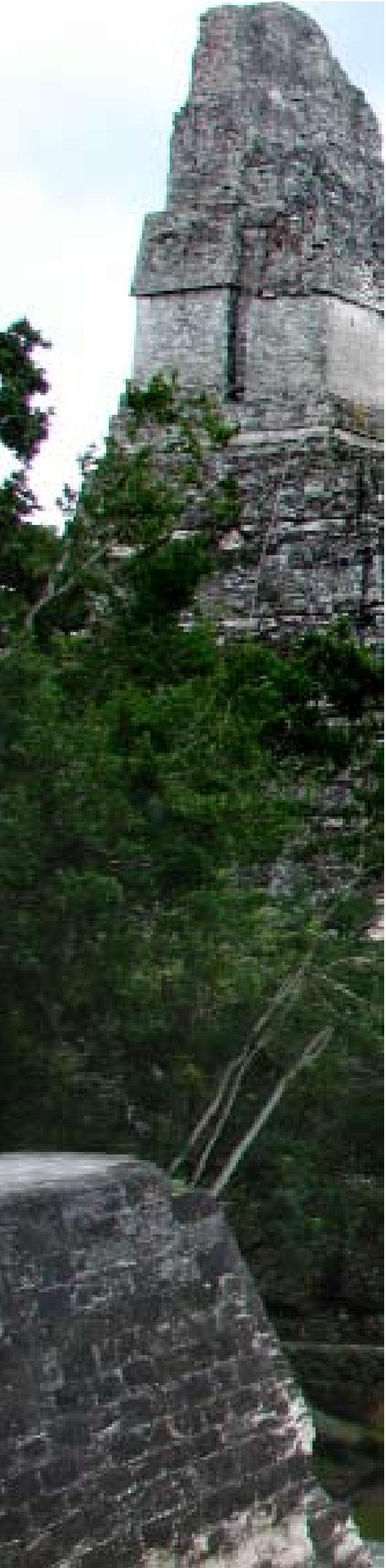
Vista del Templo II y la Plaza Mayor de Tikal. Al fondo, Templo IV. L.Meléndez.