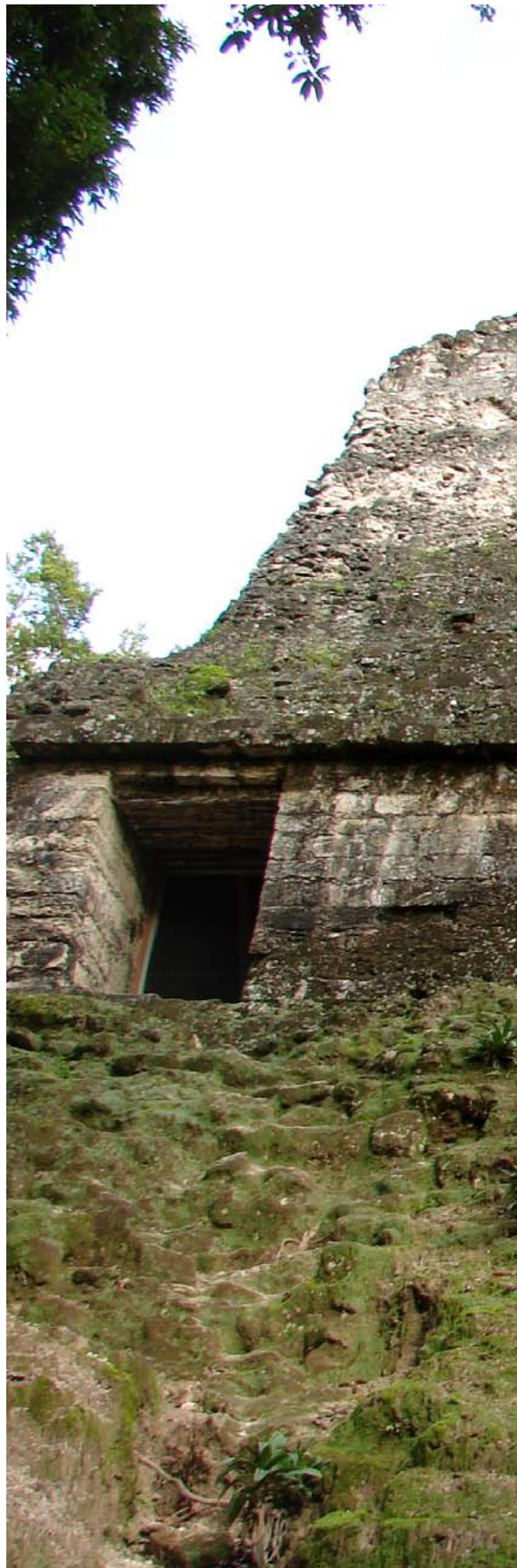
Detalle de Templo V dentro del complejo Mundo Perdido. L.Meléndez.

El período de su apogeo fue el Preclásico Tardío (250aC-250dC). Río Azul fue el centro administrativo de una región