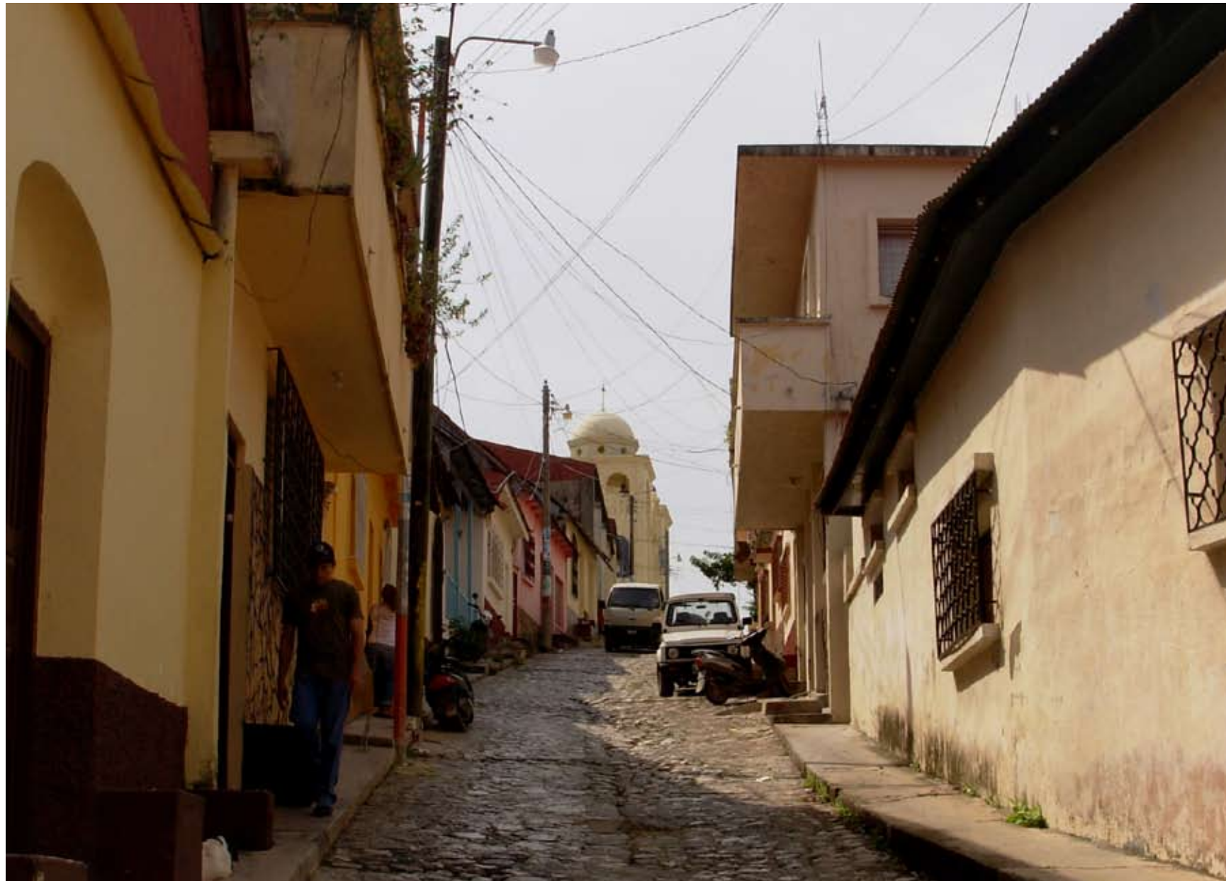
Arriba: Callejón secundario dentro de Isla de Flores, cabecera departamental de Petén. LMeléndez. Siguiente Página: En primer plano, Mundo Perdido. En el plano secundario, Bosque húmedo subtropical. LMeléndez.

grandes brazos de aserrín, al compás de la música. Con su cara pintada y su cabello rizado, es una sátira a las mujeres. El caballito, o tata Vicente, es un espíritu que sembraba el terror entre los viajeros por las noches, y baila con La Chatona, mientras “la cuida” para que no se le acerquen. A estos dos personajes se les unen, en el baile, los enmascarados, quienes no son más que una burla a los hombres. El caso es que mientras estos personajes bailan, los peteneros cantan y se divierten.